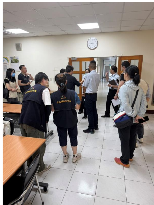
執行搜索並查扣中聯油脂股份有限公司之設備機具