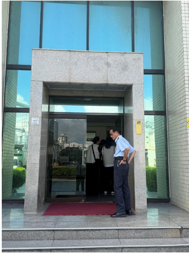
福懋油脂股份有限公司臺中廠