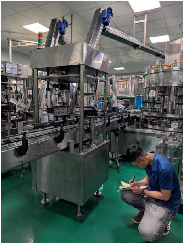
查扣福壽實業股份有限公司之設備機具