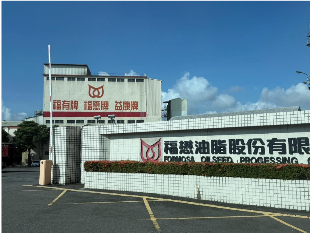
福懋油脂股份有限公司臺中廠