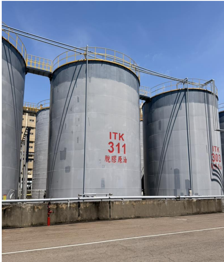
中聯油脂股份有限公司