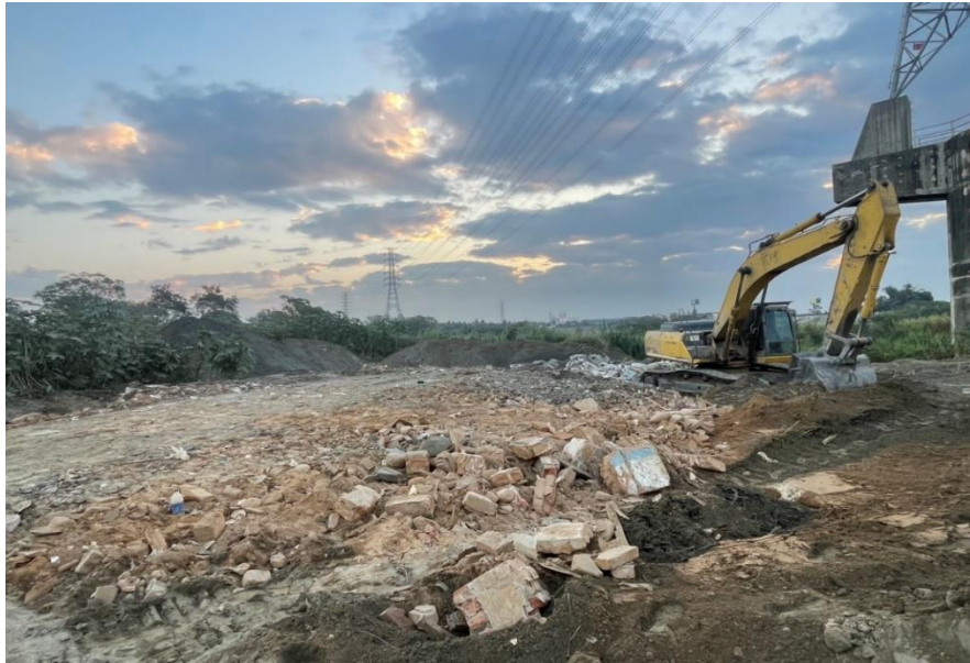
↓專案小組開挖遭竊佔國有地照片