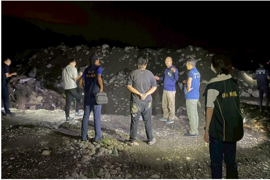
↓專案小組查獲廢棄物產源端廠房照片